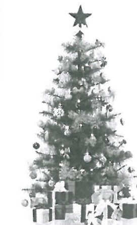
Kom til julemøde i Filskov